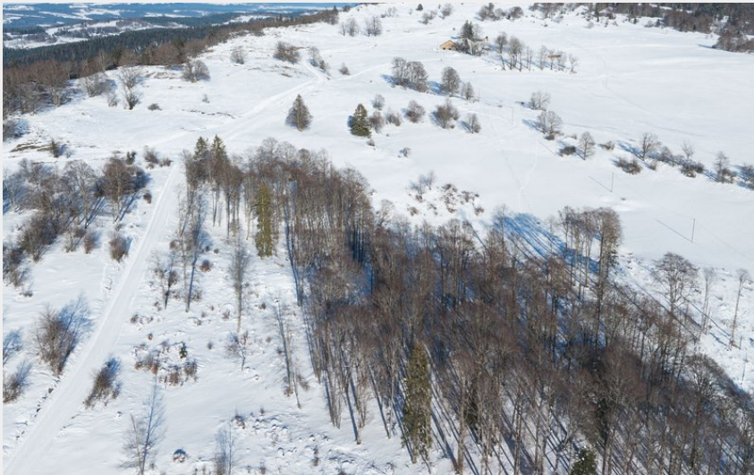
Vue aérienne de la piste