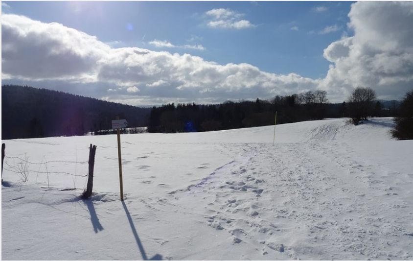
(© Jean-Luc Girod)