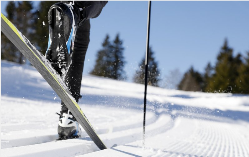
(T. Hytte / Klip.fr)