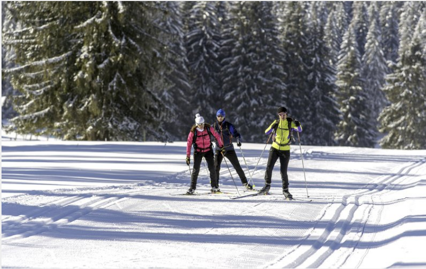
(© Laurent CHEVIET)