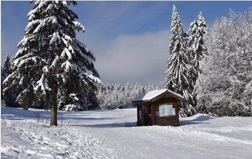
(© Philippe Carrara)