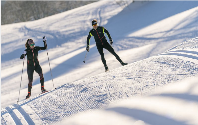
(© Benjamin Becker)