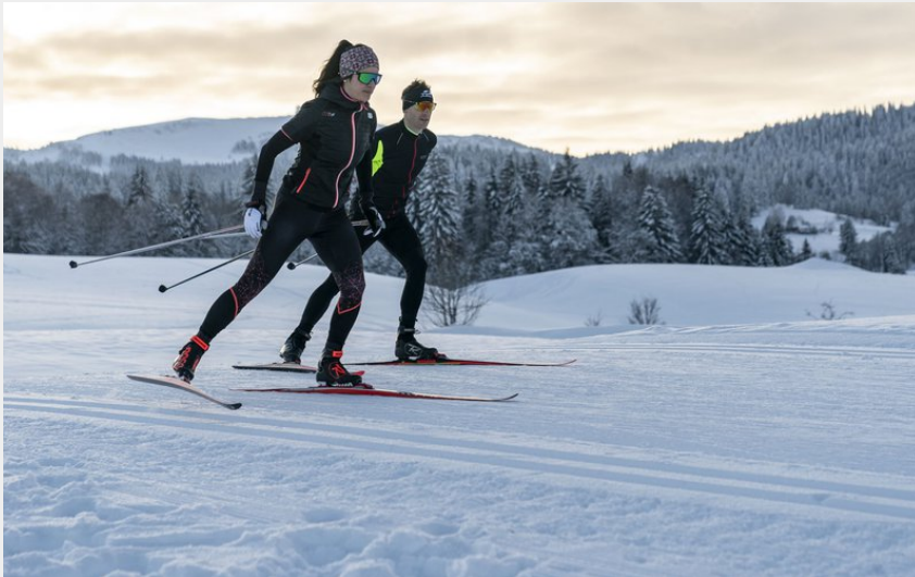
(© Benjamin Becker)