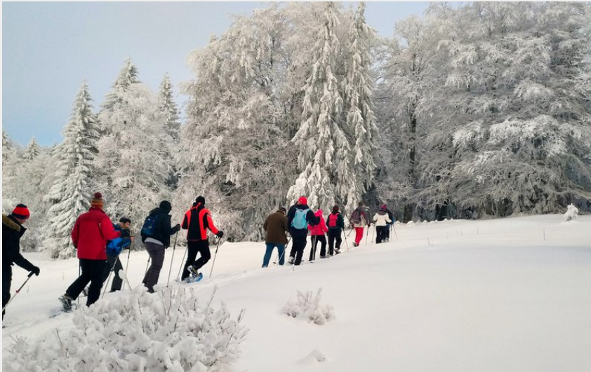
Balade raquettes dans les Montagnes du Jura