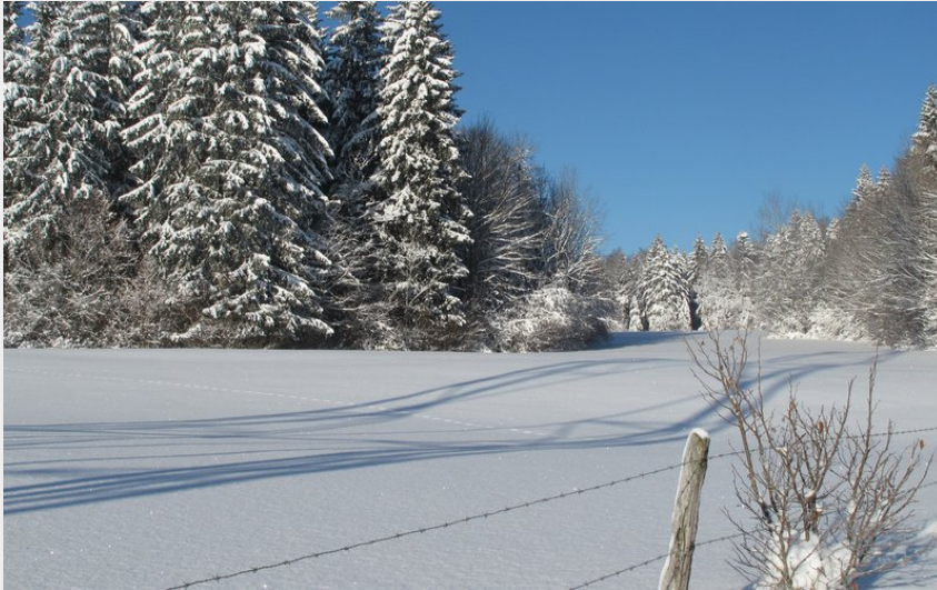
Crédit photo : Paysages enneigés du Grandvaux (Ot Haut Jura Grandvaux)